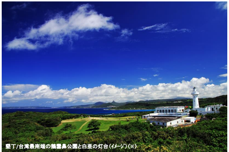
墾丁/台湾最南端の鵝鑾鼻公園と白亜の灯台(イメージ)※