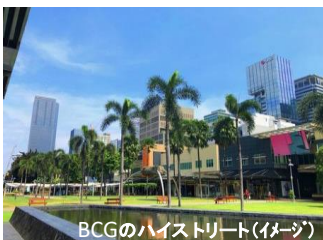
BCGのハイストリート(イメージ)