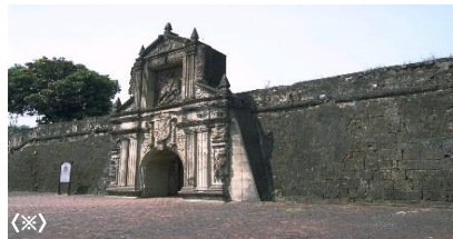
▲サンチャゴ要塞(イメージ)