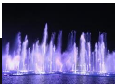
▲オカダマニラの噴水ショー「ザ・ファウンテン」(イメージ)