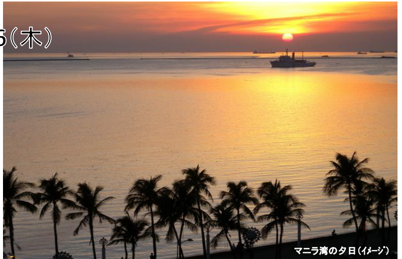
マニラ湾の夕日(イメージ)

(フィリピンへの入国に際し、すべての渡航者は出発予定時刻の72時間前から電子旅行情報システム「eTravel」への事前登録が必要となっています。フィリピン政府公式ウェブサイトから無料で登録できますが、当社にて代行手続きをご希望の場合は、1件につき代行手数料8,800円を申し受けます。実費はかかりません。)