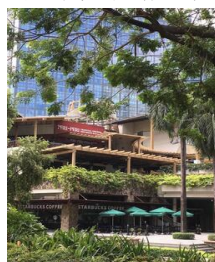
▲ショッピングモール、グリーンベルト(イメージ)