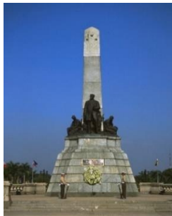
▲リサル公園のリサル像(イメージ)