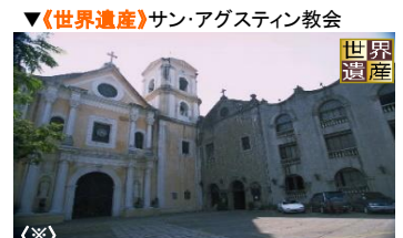
▼《世界遺産》サン・アグスティン教会