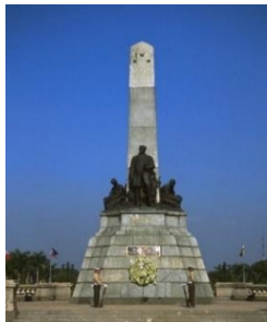
▲リサル公園のリサル像(イメージ)