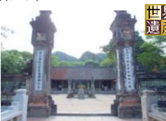
▲ディンティエンホアン祠/ホアルー